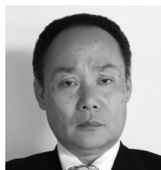
松江ガス供給株式会社 常務取締役