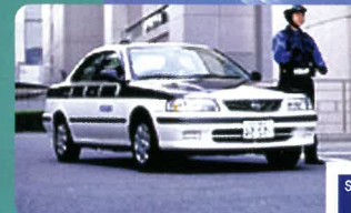
SH24はALSOK山陰の協力により完成しました。